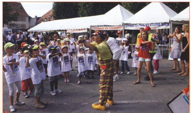
Des jeux animés par Pipo le clown et des courses pour les enfants sont proposés à chaque arrivée par la confédération nationale de la boulangerie. Tous les participants reçoivent un maillot.