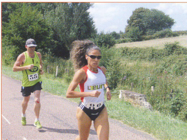
▲ Chaque équipe compte au moins une féminine.