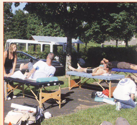
▲ Un service médical compétent et sympa soigne les petits et gros « bobos » durant les deux semaines de course.