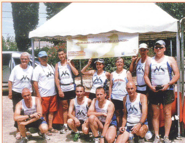
▲ Depuis 20 ans l'équipe de Courir pour la Vie-Courir pour Curie participe à la France en Courant afin de sensibiliser à la lutte contre le cancer.