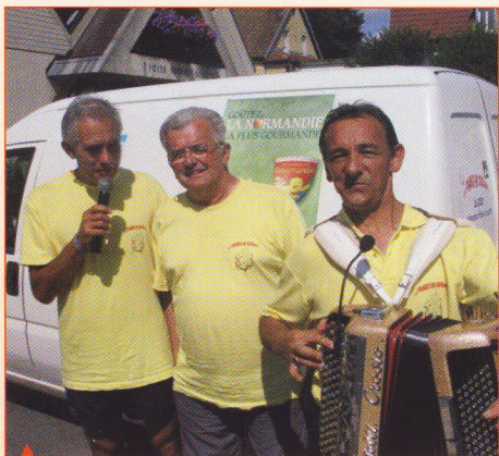
▲ Claude le chanteur, Patrick l'accordéoniste et Claude le commentateur sportif animent les étapes et demi étapes.