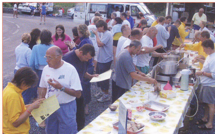
▲ Le petit déjeuner est un moment de convivialité apprécié de tous.